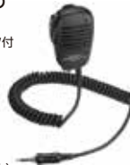
MH-57A4B スピーカーマイク 本体価格4,700円(税抜)