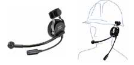
SSM-60H スポーツ/工事ヘルメット用ヘッドセット 本体価格13,200円(税抜)

ヘルメットに装着するタイプのヘッドセット ※本体との接続にはSCU-11が必要です。