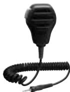
MH-73A4B 防浸型スピーカーマイク 本体価格5,200円(税抜)