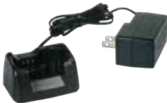
SBH-31 急速充電器 本体価格 2,800円(税抜)

充電して繰り返し使用できるNi-MH電池パック ※充電は専用充電器SBH-31をご使用下さい。