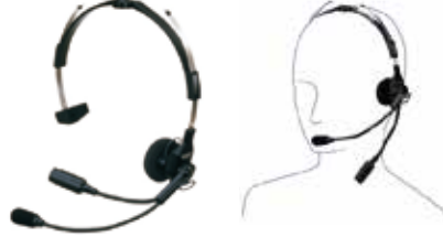
SSM-62H インターコム型ヘッドセット 本体価格4,800円(税抜)

ヘルメットに装着するタイプのヘッドセット ※本体との接続にはSCU-11が必要です。