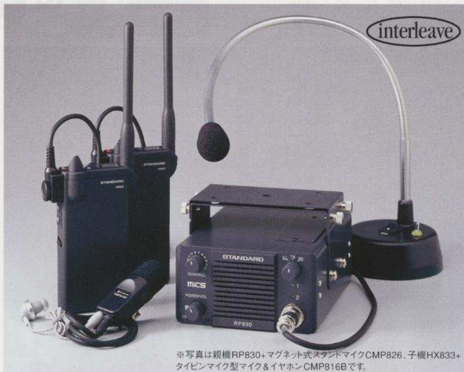
※写真は親機RP830+マグネット式スタンドマイクCMP826、子機HX833+ タイピンマイク型マイク&イヤホンCMP816Bです。

アクティブなハンズフリーで日常会話のように話せる無線インカム。 迅速・確実な連絡と誘導で育てる安全な作業環境。ミックス・ジュニアです。